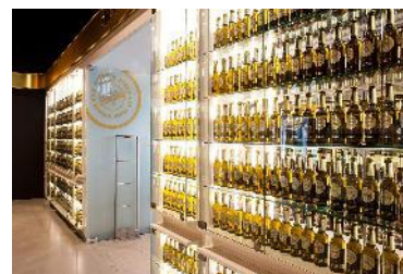
• Bezoek en proeverij in Warsteiner Welt