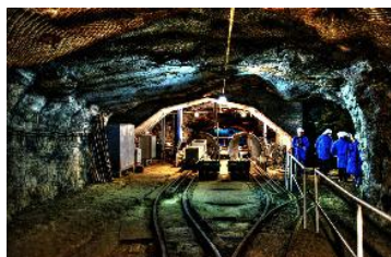
• Rondleiding door de Ertsmijn in glasblazer