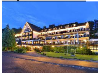
• all-inclusieve concept in Hotel Alpin