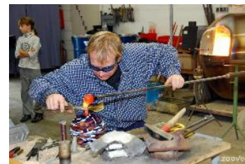
• Demonstratie bij een authentieke

Vijfdagen weg geheel verzocht voor 469,00 per persoon