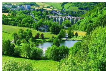
Ramsbeck • Rondrit door Sauerland