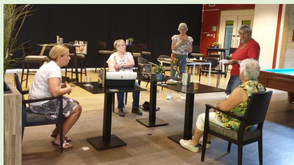
Vooraf instructie en uitleg over de regels

Op dinsdag 2 juni zijn de dames voor het eerst sinds lange tijd weer gaan biljarten.