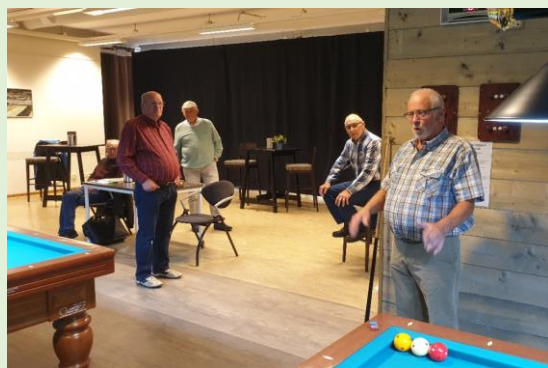
Ook voor de mannen instructie vooraf.

Ook voor de heren is het biljarten weer begonnen op maandagmiddag 8 juni werd er weer door de leden van BCPO in 't Web gebiljart volgens het opgestelde protocol.