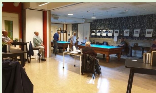
Biljarten zoals het nu mogelijk is met voldoende afstand